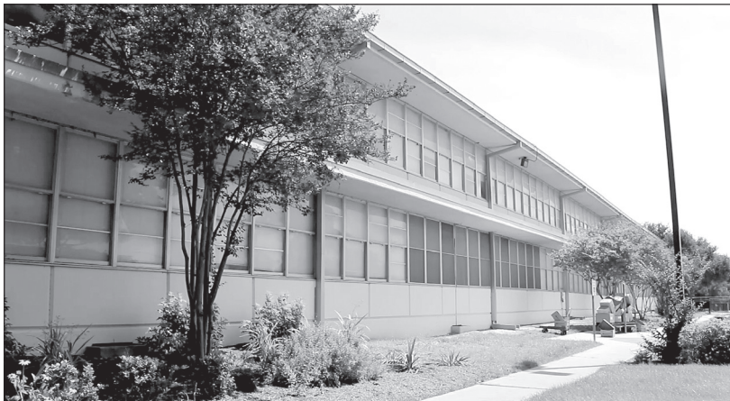
Todas las escuelas del Distrito recibirían actualizaciones de seguridad con cámaras interiores y exteriores.

Para los 21 planteles, los proyectos de renovación variarán por escuela, pero lo que la mayoría tienen en común son renovaciones y actualizaciones como: infraestructura, salones de clase, cafeterías y cocinas, baños, accesibilidad de necesidades especiales y modificaciones especiales a las entradas principales. Estas renovaciones le permitirían al Distrito proporcionar instalaciones que son más equitativas a lo que se ofrece en los distritos escolares vecinos.