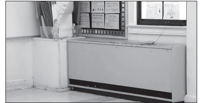
Las actualizaciones a la infraestructura de los edificios incluirían reemplazar sistemas viejos e ineficaces de calefacción, ventilación y climatización (HVAC); de plomería; eléctricos; y mecánicos con nuevos sistemas eficientes.

Además, se destinarían fondos a edificios que ofrezcan nuevos modelos escolares, entre ellos Rodriguez Montessori Elementary y Young Women's Leadership Academy –