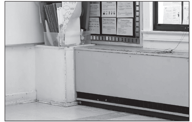
Building infrastructure upgrades would include replacing old, inefficient heating, ventilation and air-conditioning (HVAC); plumbing; electrical; and mechanical systems with efficient new systems.