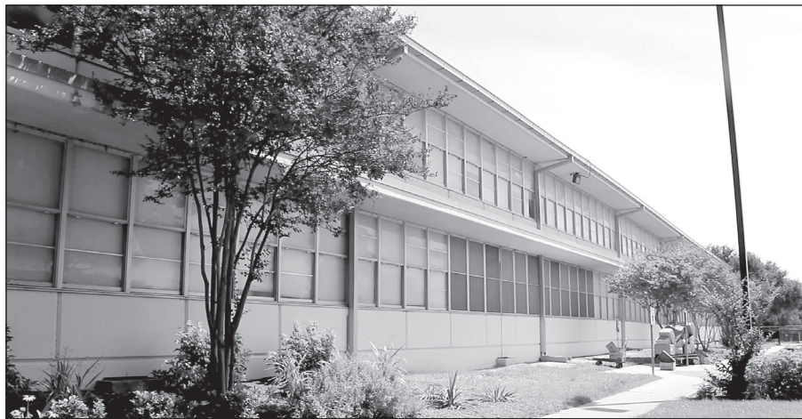
All schools across the District would receive security upgrades with interior and exterior cameras.

For the 21 campuses, renovation projects will vary by school, but what the majority have in common are renovations and upgrades such as: infrastructure, classrooms, cafeterias and kitchens, restrooms, special-needs accessibility, and safety modifications to front entries. These renovations would enable the District to provide facilities that are more equitable with what is offered in neighboring school districts.